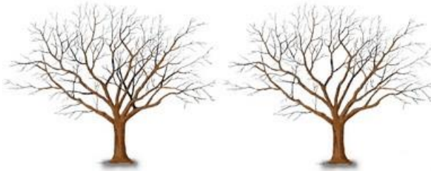
Rys.2. Cięcie sanitarne**